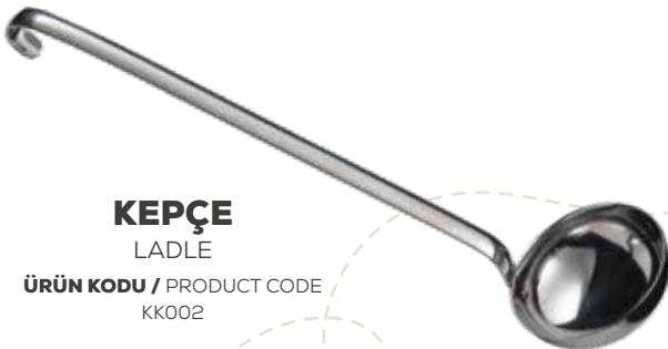
KEPÇE LADLE ÜRÜN KODU / PRODUCT CODE KK002