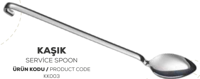
KAŞIK SERVICE SPOON ÜRÜN KODU / PRODUCT CODE KK003