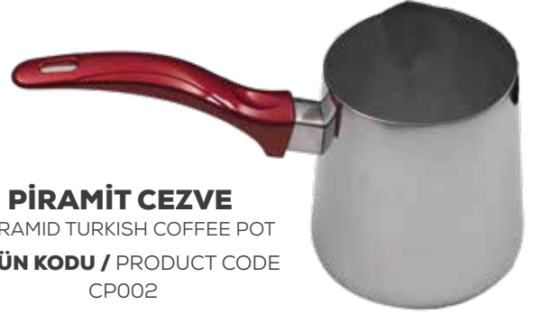
PİRAMİT CEZVE PYRAMID TURKISH COFFEE POT ÜRÜN KODU / PRODUCT CODE CP002