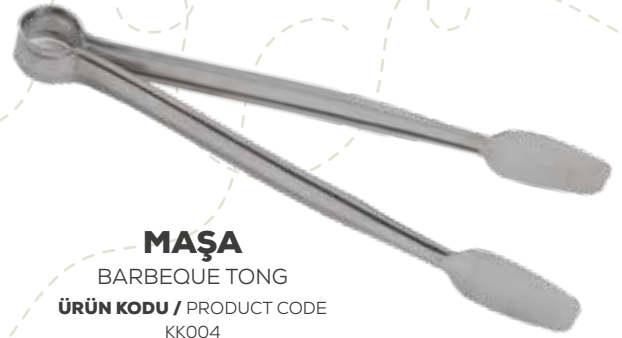
MAŞA BARBEQUE TONG ÜRÜN KODU / PRODUCT CODE KK004