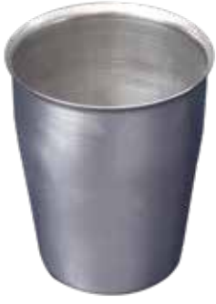
DÜZ BARDAK METAL CUP ÜRÜN KODU / PRODUCT CODE B001