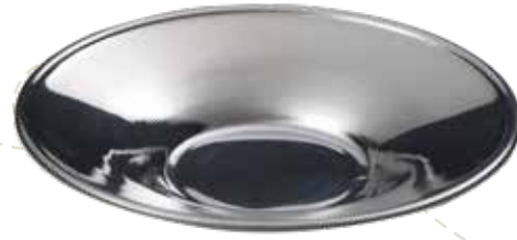
ÇAY TABAĞI TEA PLATE ÜRÜN KODU / PRODUCT CODE CT002