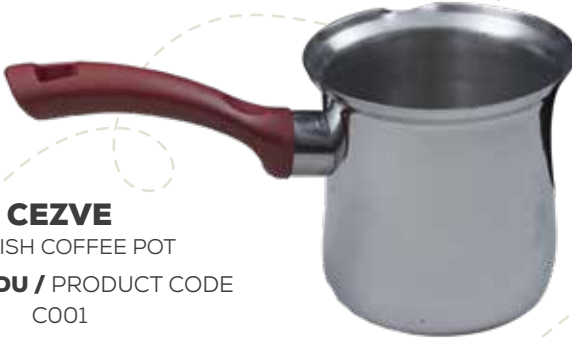
CEZVE TURKISH COFFEE POT ÜRÜN KODU / PRODUCT CODE C001