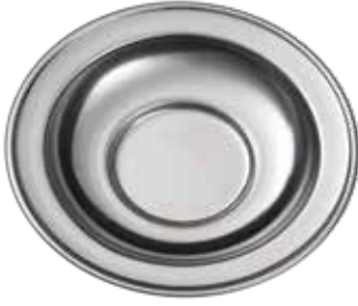
ÇAY TABAĞI TEA PLATE ÜRÜN KODU / PRODUCT CODE CT001