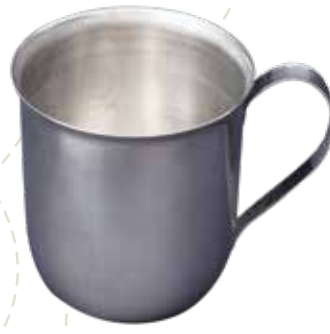
KULPLU BARDAK METAL CUP WITH HANDLE ÜRÜN KODU / PRODUCT CODE B002